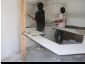
2007 西武庫地地リフォーム