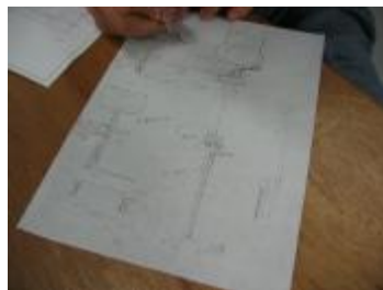
細部の検討スケッチ