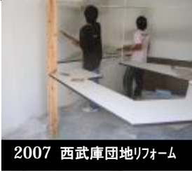
2007 西武庫園地リフォーム