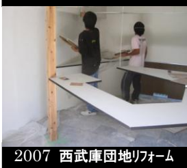
2007 西武庫園地リフォーム